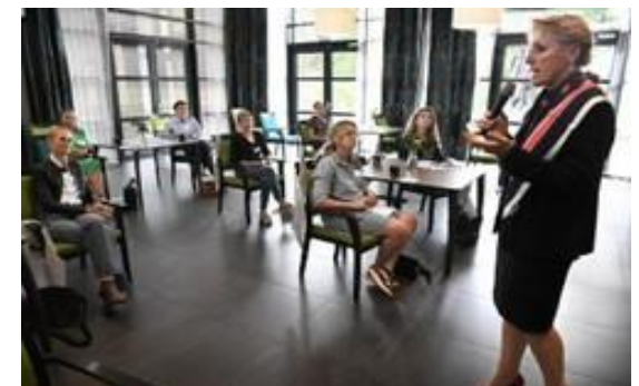
ARTIKEL VOLKSKRANT BEKIJKEN