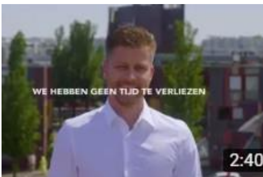
SAMEN ECHT ANDERS DOEN BEKIJKEN