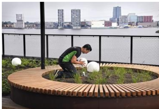
ARTIKEL VOLKSKRANT BEKIJKEN