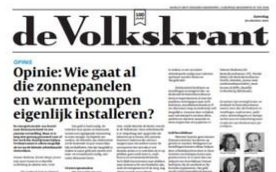
ARTIKEL VOLKSKRANT BEKIJKEN