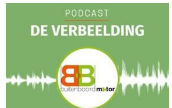
PODCAST DE VERBEELDING BEKIJKEN