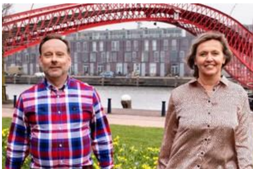
SER MAGAZINE BEKIJKEN