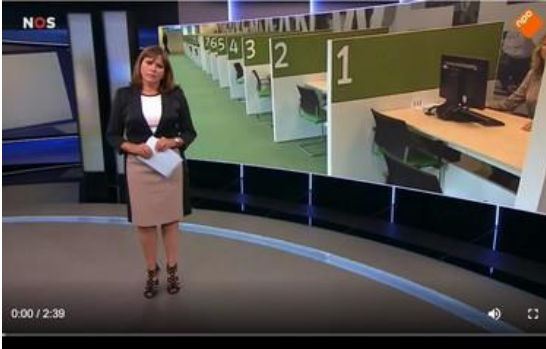
NOS- JOURNAAL BEKIJKEN