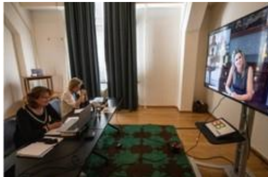
BEZOEK KONINGIN MÁXIMA BEKIJKEN