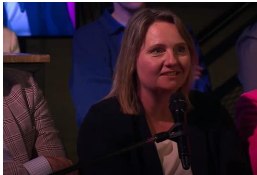
TALKSHOW KRAP UWV BEKIJKEN