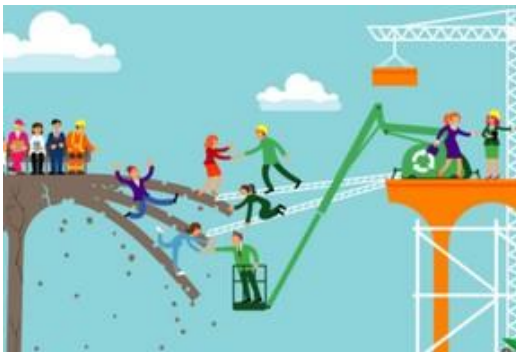
MANAGEMENT SCOPE BEKIJKEN