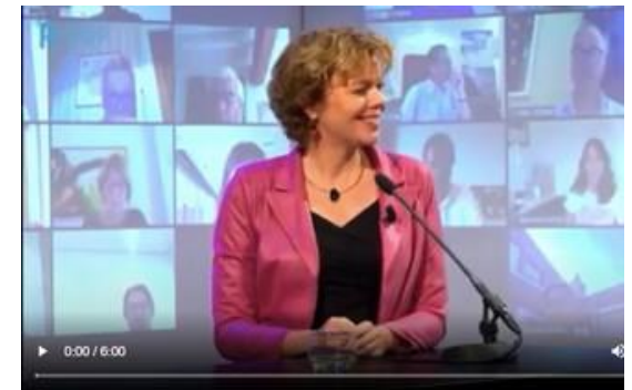
WEBINAR VNO-NCW BEKIJKEN